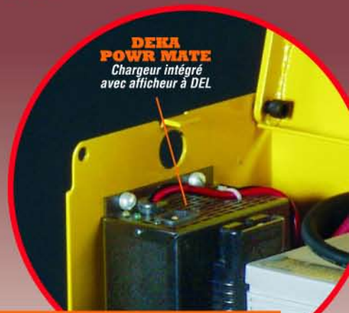
DEKA POWER MATE Chargeur intégré avec afficheur à DEL

DEKA POWER MATE ... puissance maximale, facilité d'opération et deux à trois fois la durée utile d'unités semblables fournies avec batteries AGM de groupes 24 et 27.